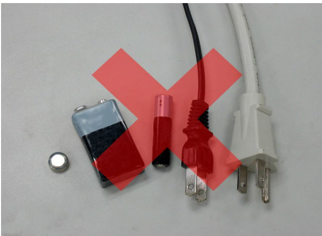
需使用電力的工具